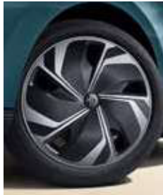
Jantes alliages 18" avec enjoliveurs aérodynamiques bi-ton