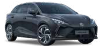
● Pebble Black Peinture métallisée (option à 650€ (1) )