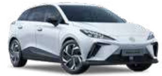
● Dover White (de série)