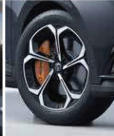
Jantes alliages 18" bi-ton et étriers de freins orange