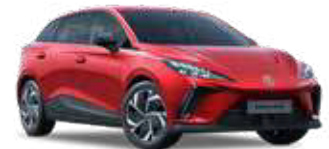
● Dynamic Red Peinture métallisée (option à 650€ (1) )