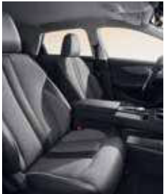
Intérieur similicuir/tissu gris