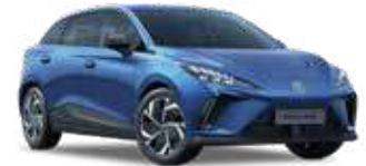
● Piccadilly Blue Peinture métallisée (option à 650€ (1) )