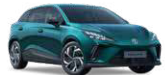
● Irises Cyan Peinture métallisée (option à 650€ (1) )