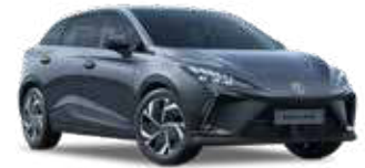
● Camdem Grey Peinture métallisée (option à 650€ (1) )