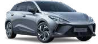
● Cosmic Silver Peinture métallisée (option à 650€ (1) )