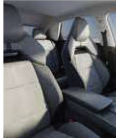
Sièges sports en similicuir/Alcantara