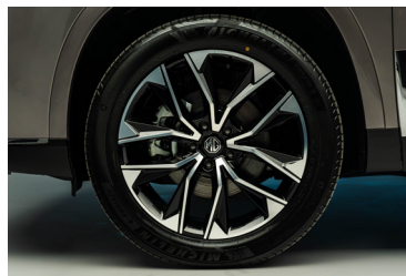
Jantes alliage 20"