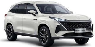
● Oxford White (de série)