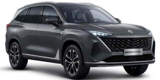
● Camden Grey Peinture métallisée (option à 650€ (1) )