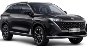
● Pebble Black Peinture métallisée (option à 650€ (1) )