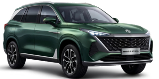
● Gloucester Green Peinture métallisée (option à 650€ (1) )