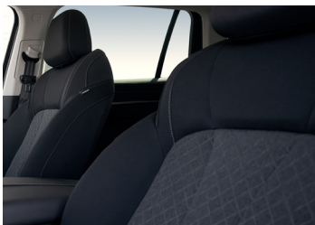
Intérieur tissu gris