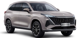
● Sterling Silver Peinture métallisée (option à 650€ (1) )